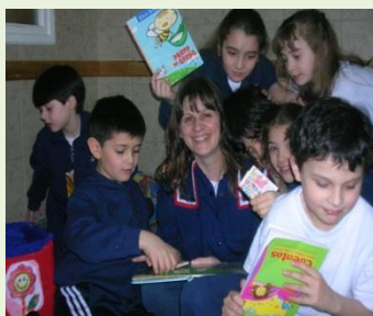
"La educación es cosa del corazón"